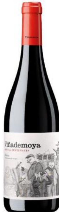
VIÑA DE MOYA