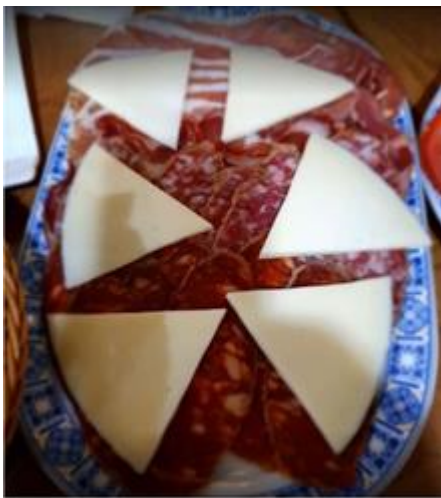
TABLA DE EMBUTIDOS

CHORIZO, JAMON, QUESO Y SALCHICHON TAPA 8.80€